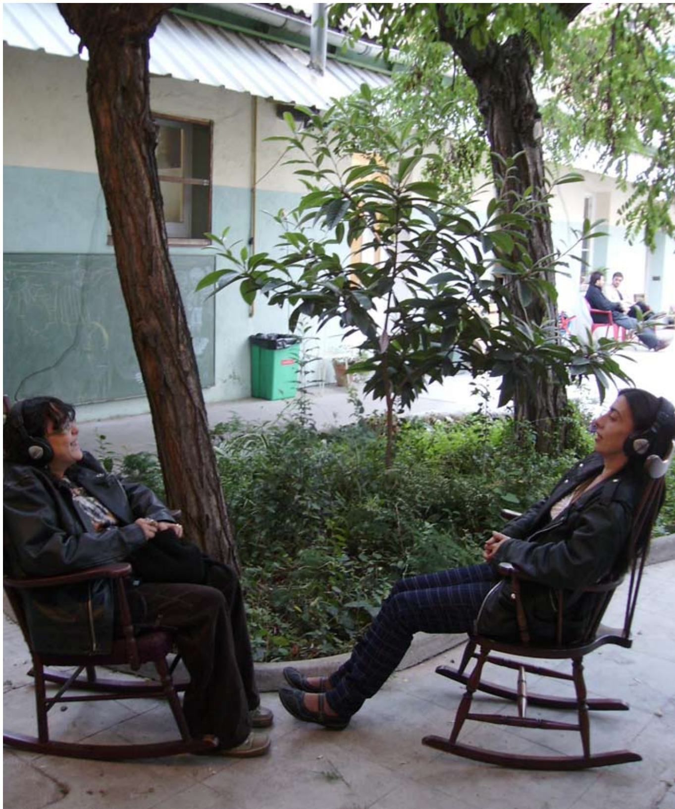
Espai EART / Experimentem amb l'ART